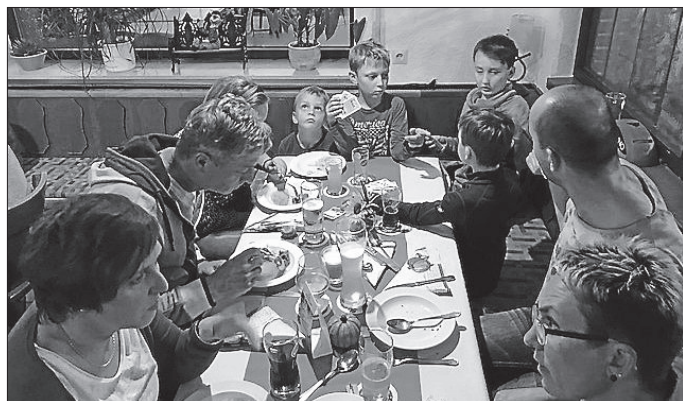
28102017 Familienfest im Landgasthaus Wiesental in Dautmergen

Dank wahlweise herzhaftem Schlachtplattenbuffet, typisch schwäbischen Gerichten und ausgesuchten Spezialitäten aus der Region sowie feinen Wildgerichten aus heimischen Wäldern und angezapften Fässern war garniert mit Sangesfreuden für jeden etwas dabei.