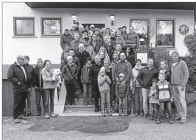
28102017 Familienfest im Landgasthaus Wiesental in Dautmergen

Zunächst machten wir bei trockener herbstlicher Witterung gemeinsam mit der Familie eine reizvolle nachmittägliche Wanderung entlang der romantischen Schlichem von Schömberg nach Dautmergen.